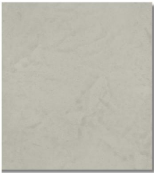
ULT 603 | Platyna