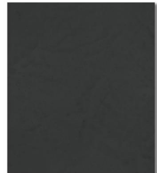
ULT 605 | Czarny diament