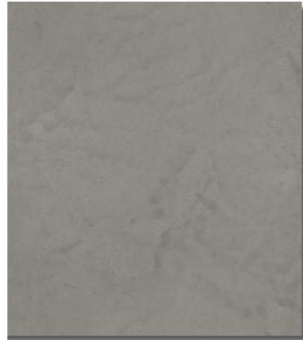
ULT 609 | Szary agat